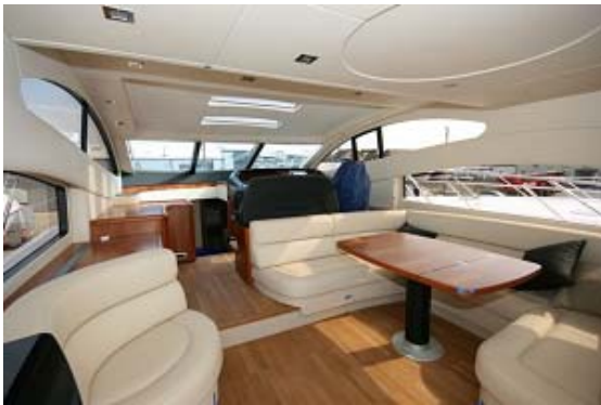
Cockpit avec hard top et salon supérieur Cockpit with hard top and saloon