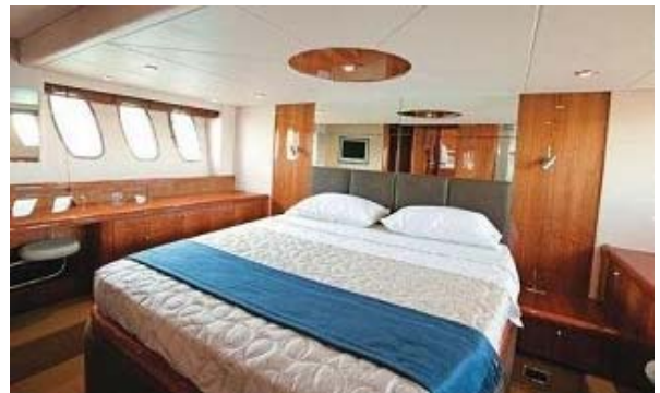
Cabine propriétaire Master stateroom